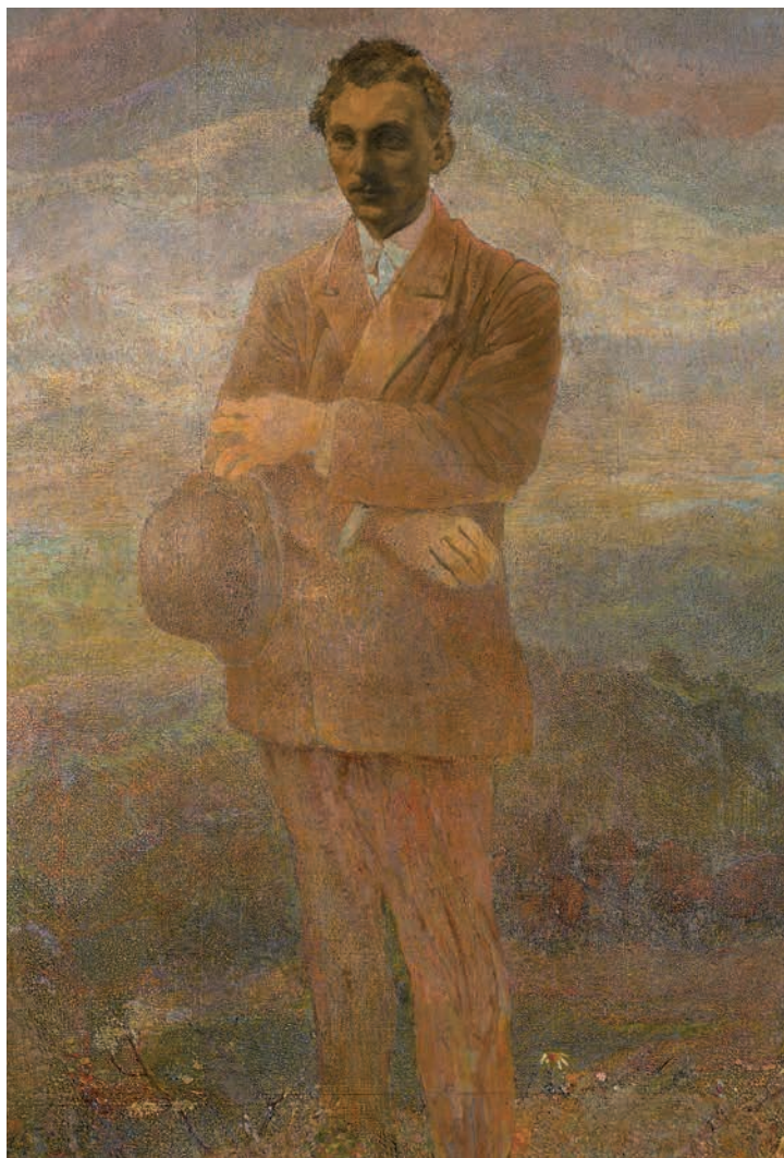
Romolo Romani Ritratto di Giacomo Dalai 1912, Brescia Musei Civici d'Arte e Storia